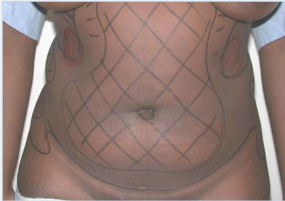
Patiënte vóór de behandeling