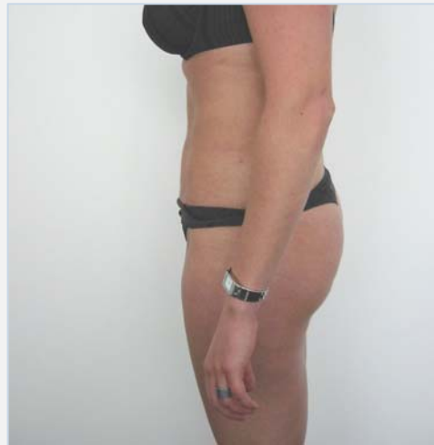
Patiënte na de behandeling