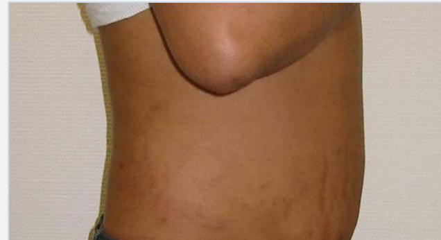
Patiënt na de behandeling