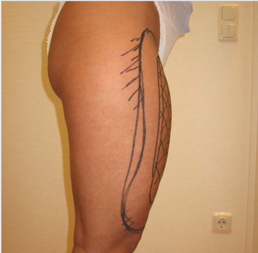
Patiënte vóór de behandeling