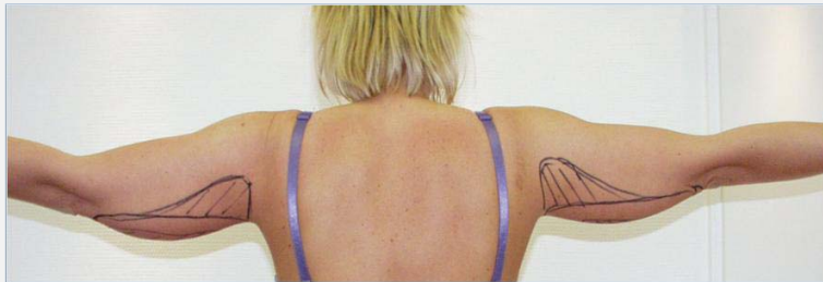
Patiënte vóór de behandeling