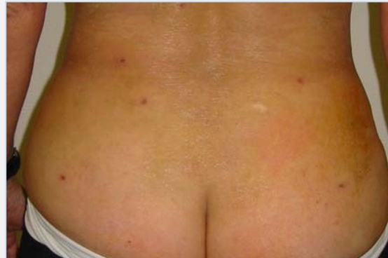
Patiënte na de behandeling