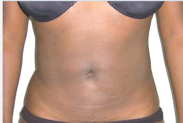
Patiënte na de behandeling