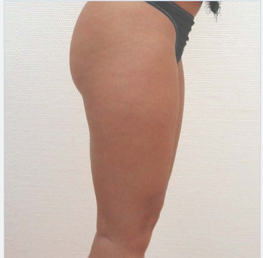
Patiënte na de behandeling