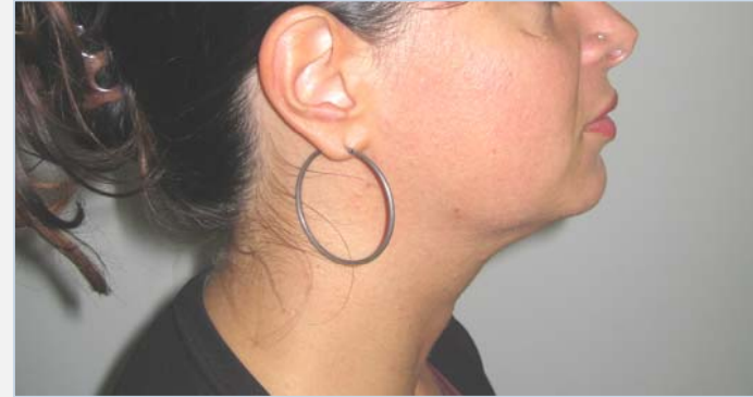
Patiënte na de behandeling