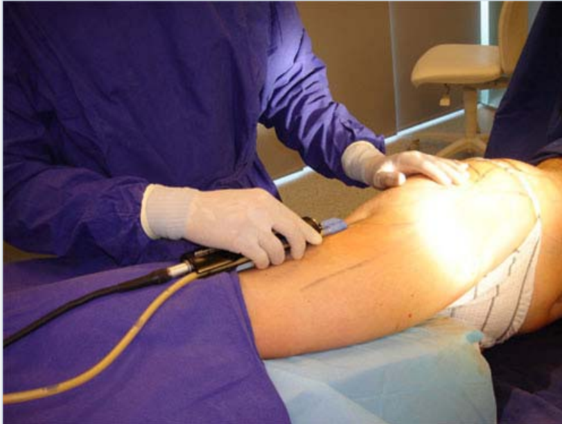
Verwijdering van de vetcellen d.m.v. microcannules

Tweede fase: De vetcellen worden op de vooraf afgesproken en afgetekende zones verwijderd d.m.v. microcannules (afzuigbuisjes) met een doorsnede van 0,5mm tot 3mm. Hierdoor krijgt het lichaam zijn nieuwe vormen en wordt de huid er toe gezet te gaan krimpen. Er wordt waar nodig een kleine incisie (sneetje) in de huid gemaakt, daartoe beweegt de chirurg de vibrerende micronaalden heen en weer, waarbij hij alle andere weefsels intact laat. De patiënt ervaart ondertussen slechts een lichte druk, maar geen pijn. Er kan aan de patiënt worden gevraagd om tijdens de ingreep regelmatig van houding te veranderen of zelfs te gaan staan waardoor de arts het te behandelen gebied en het resultaat beter kan beoordelen.