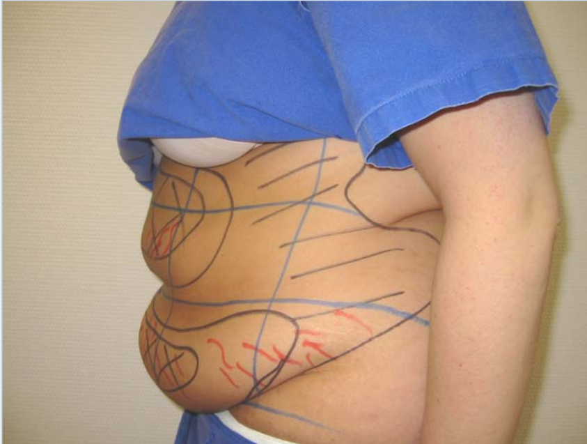
Patiënte vóór de behandeling