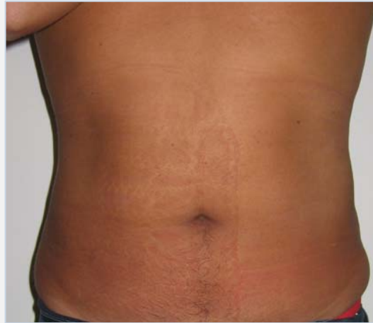
Patiënt na de behandeling