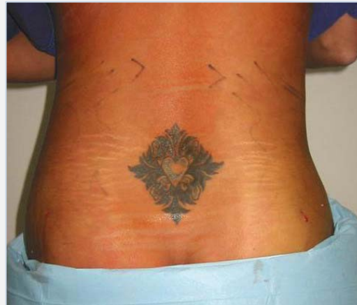
Patiënte onmiddellijk na de behandeling