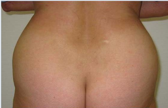
Patiënte vóór de behandeling