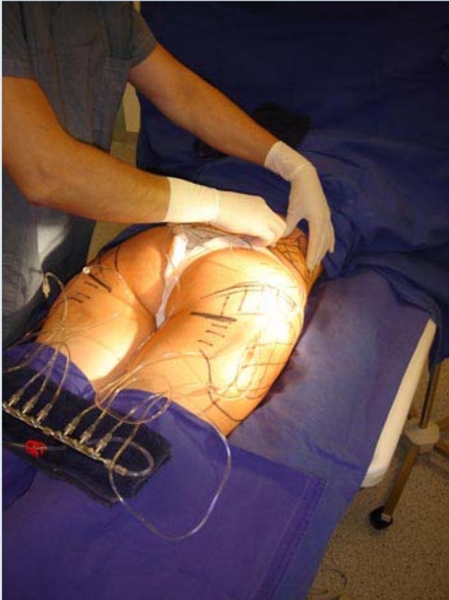
Infiltratie van de tumescence verdovingsvloeistof via ultradunne naaldjes

De behandeling vindt plaats onder plaatselijke verdoving, meestal in combinatie met een licht kalmerend middel. Zo ervaart de patiënt de behandeling op een rustige en aangename manier. Nadat de patiënt is gedesinfecteerd, wordt er gestart met de behandeling. Deze bestaat uit 2 fases: