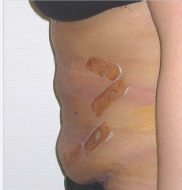
Patiënte na de behandeling