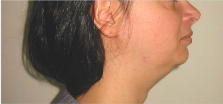
Patiënte vóór de behandeling