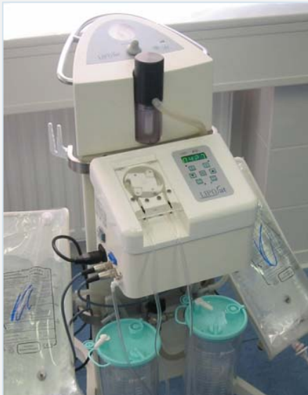
Speciale apparatuur voor de microcanulaire-vibro-liposuctie

De microcanulaire-vibro-liposuctie is een technisch hoogstandje waarbij een trillende microcanule gebruikt wordt welke het vetweefsel los trilt zodat het op deze manier exacter en meer gedoseerd verwijderd kan worden.