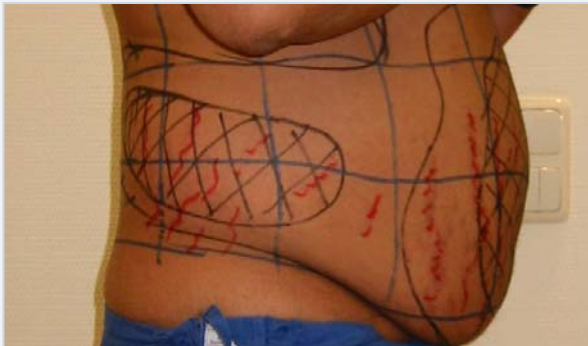
Patiënt vóór de behandeling