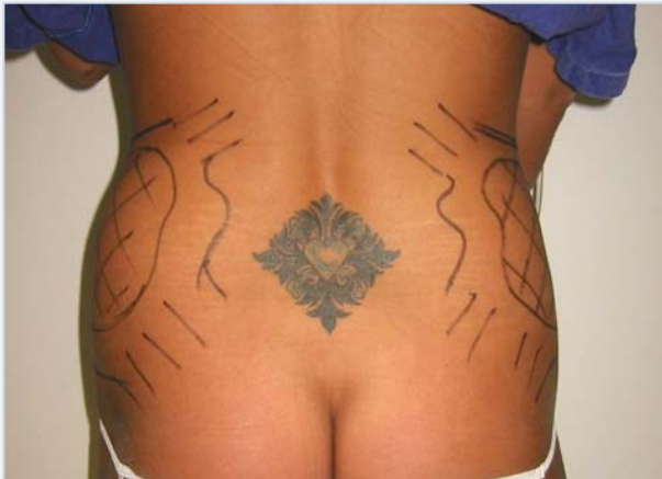
Patiënte vóór de behandeling