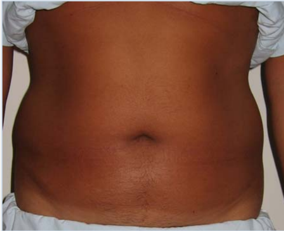
Patiënt vóór de behandeling